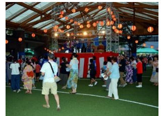
▲围着高台跳舞的人们

80 多名来自夏威夷「火奴鲁鲁福岛县人会」和「火奴鲁鲁福岛孟蓝盆舞蹈俱乐部」的成员来福岛市访问，并于 7 月 22 日（周六）参加了在福岛市四季之里举办的「福岛·夏威夷·孟蓝盆舞蹈节」。孟蓝盆是随着移民一起去了夏威夷，现在成为孟蓝盆舞蹈形式被继承下来。这次，一行与祖籍所在地的市民通过一起跳舞来增进交流，对于他们来说是非常有意义的一件事。