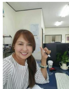
▲从5年前开始在白河市内的企业工作

我来到日本后, 先在东京、广岛及群馬等地居住了一段时间, 10年前搬到白河市一直生活至今。和菲律宾相比, 日本的生活非常安全, 而且关于女性就业方面的制度也很完善, 所以无论在日本的什么地方生活, 印象中都没有发生过不好的事。但是在东日本大地震发生时, 因为当时没有收集信息的手段, 所以一些信息及祖国的大使馆发出的重要通知都是事后才知道的。有了这次经验以后, 现在特别注重和朋友以及同胞的交流, 经常用智能手机和大家联系, 并且在生活中遇到问题后大家能互相帮助。