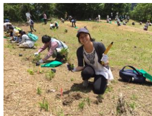
▲6月份参加了「全国植树祭一周年前纪念活动」

在我的祖国有各种各样关于东日本大地震的报道。我最留意的是关于放射线的信息, 对健康有没有影响、对生活带来什么不便等等, 并且注重这些信息是否是由专门机构发表的正确消息。另外, 我的出生地巴西圣保罗州是一个没有暴雨、台风、大雪之类特大自然灾害的地方, 为此我也事先考虑了