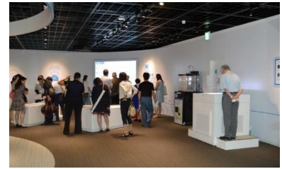
▲正在聚精会神的观看体验区（放射线实验室）展示内容的外国人

馆内除了有福岛的自然环境和放射线关联的展示之外，还有 360°C 全景放映剧场，通过这些方法可以了解正在走向未来的福岛的「今天」。在体验区内的「放射线实验室」，既有通俗易懂的展示，又可以通过游戏形式来学习放射线、放射能、放射性物质的不同点，以及放射线量是如何渐渐减少的等等内容，为大家各自做自我判断提供了各种信息。