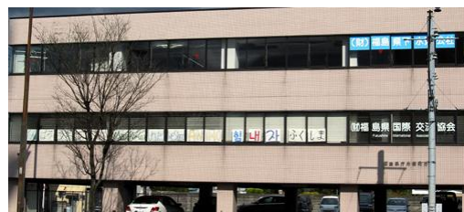
福岛县国际交流协会张贴的标语