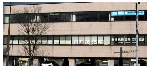
Messages aux fenêtres de notre