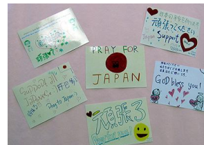
Messages de soutien reçus de Taiwan